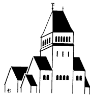
St. Meinolphus-Mauritius (MM) Gemeindebüro Meinolphusstr. 2 Zurzeit geschlossen Tel.: 301313 / Fax: 3245466