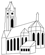
St. Antonius (AT) St. Marienstift (MA)