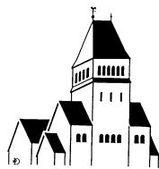
St. Meinolphus-Mauritius (MM) Gemeindebüro Meinolphusstr. 2 Mo: 09.00 - 11.30 Uhr Do: 16.00 - 18.00 Uhr Tel.: 301313 / Fax: 3245466