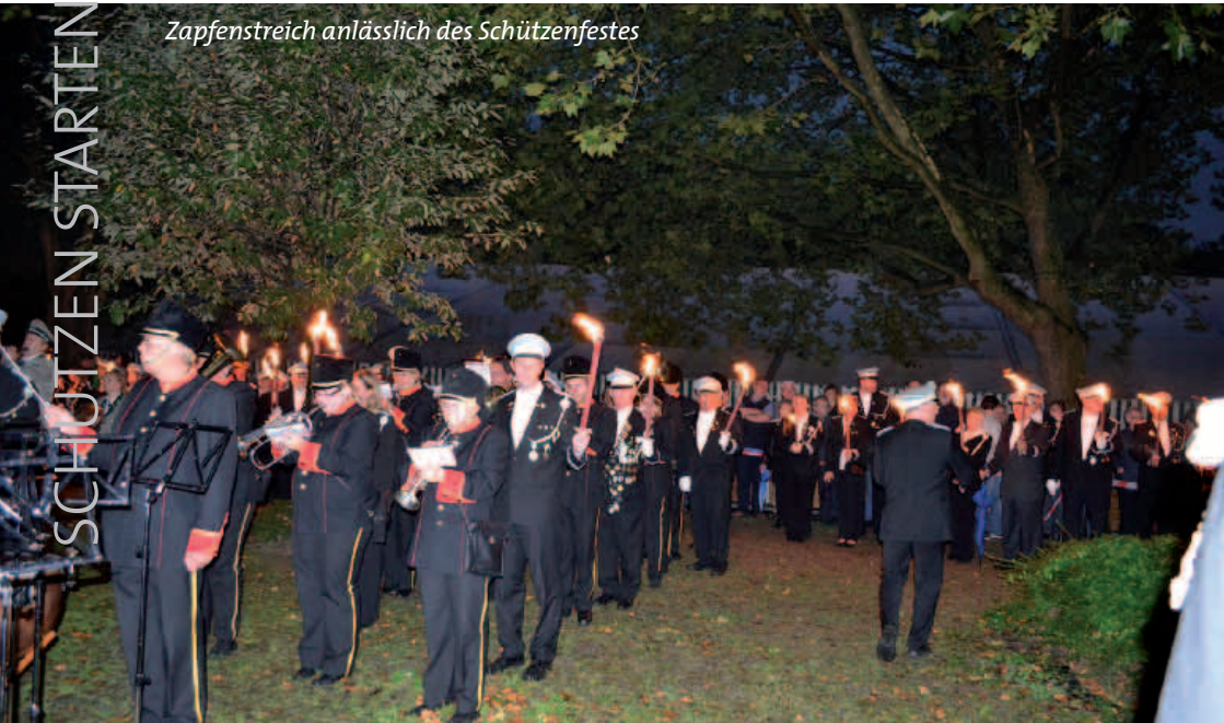
Zapfenstreich anlässlich des Schützenfestes

Nachdem wir leider unser Schützenfest 2021 absagen mussten, haben wir uns auch für dieses Jahr aufgrund der hohen Inzidenzen nicht getraut, ein großes Volksfest zu organisieren. Gleichwohl sind die Schützen zuversichtlich am 2. und 3. September 2022 eine Königs- und Schützenparty rund um das Schützenhaus zu feiern. Am Freitag lädt der ABSV zu einem gemütlichen Abend sowie zum Großen Zapfenstreich ein. Einen Tag später ist mit den befreundeten und Riemker Vereinen ein kleiner Festumzug durch Riemke geplant. Alle sind eingeladen, mit uns hoffentlich zwei unbeschwerte Tage zu verbringen.