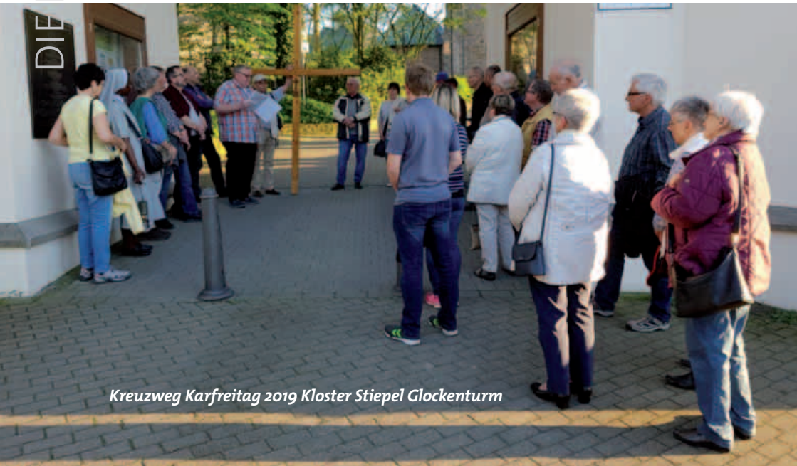
Kreuzweg Karfreitag 2019 Kloster Stiepel Glockenturm

So fand dieses Jahr am Donnerstag, dem 3. März 2022, wieder die heilige Stunde in Hamme mit der anschließenden Generalversammlung des Stadtbezirkes Bochum der Ehrengarden statt.