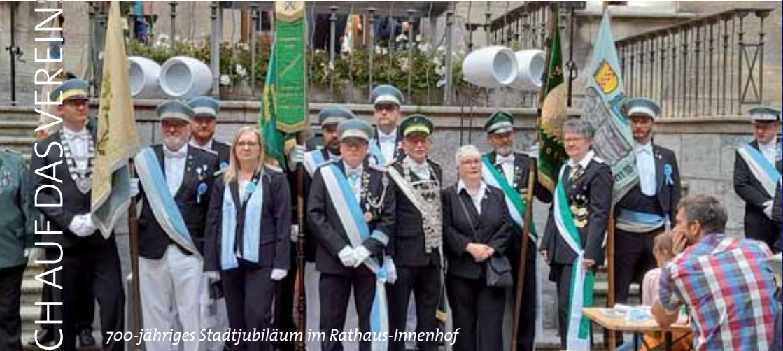
700-jähriges Stadtjubiläum im Rathaus-Innenhof

Zum 700-jährigen Stadtjubiläum haben sich die acht großen Schützenvereine in Bochum zusammengeschlossen und einen Werbemarsch durch die Innenstadt zum Rathaus durchgeführt. Anlässlich des Tages des offenen Rathauses am 18. September 2021 haben die Vereine der Stadt zum Jubiläum gratuliert und Banner mit den Vereinslogos übergeben. Sie werden z.B. zum Maiabendfest vom Rathausbalkon wehen.