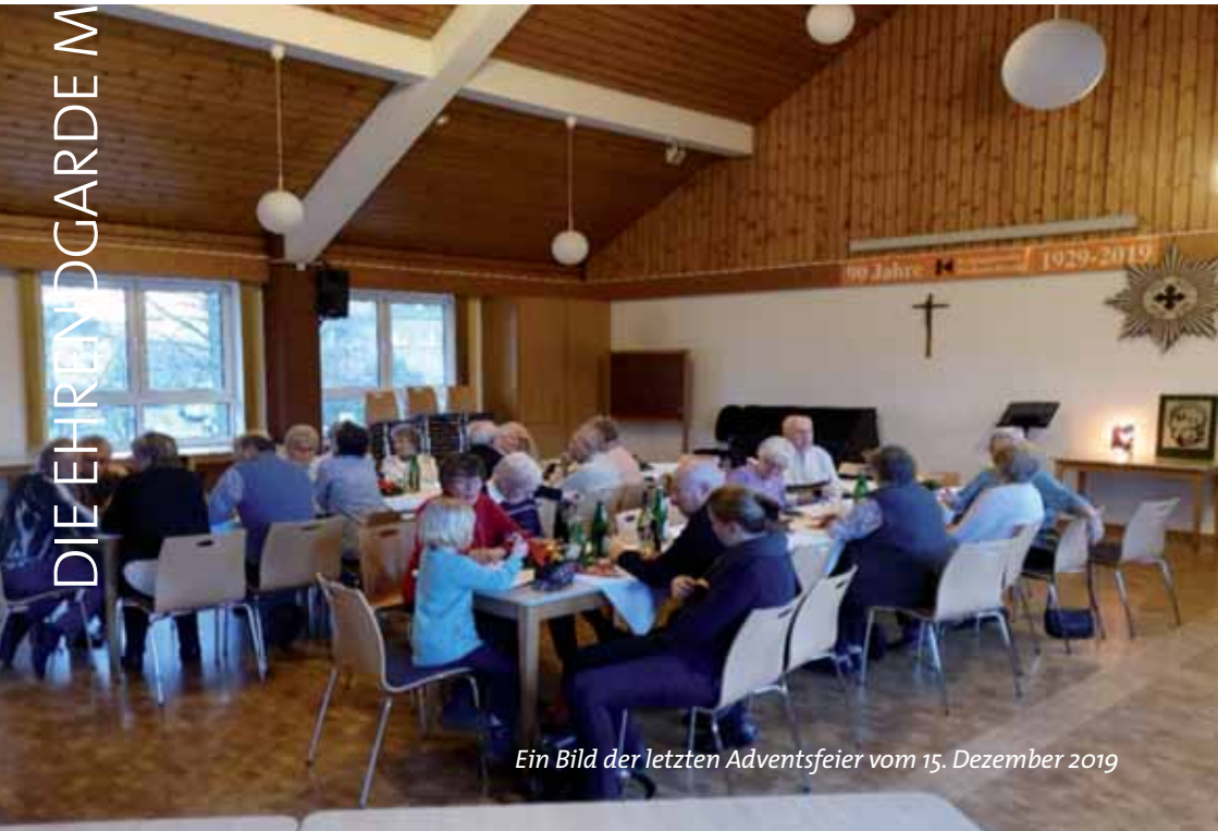
Ein Bild der letzten Adventsfeier vom 15. Dezember 2019

Fronleichnam fand in einer anderen Form statt. Nichtsdestotrotz lassen wir uns, wie die anderen Vereine auch, nicht unterkriegen.