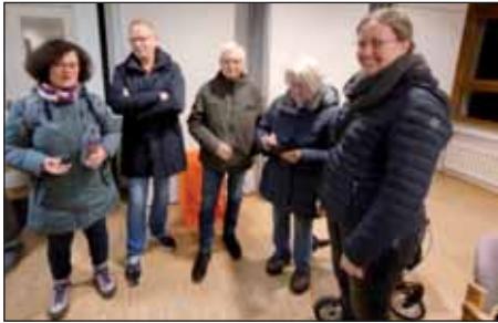
Begegnung im Pfarrsaal vom St. Marien Zisterzienserkloster nach der Komplet.

Wie immer starteten wir nach der Karfreitagsliturgie um 16.15 Uhr mit einer kurzen Einstimmung am Riemker Marktplatz. Es waren diesmal 13 Mitläufer dabei. Der Weg führte uns die altbekannte Strecke an der Markscheide, die Tippelsberger Str., den Grummer Teichen und Josef Hospital vorbei, über den Stadionring, Gersteinring, die neue Lohringbrücke, Springorum Radweg, Wiemelhauser Str., Marktstr, Baumhofstr., Kastanienweg, Charlottenstr., Königsallee,