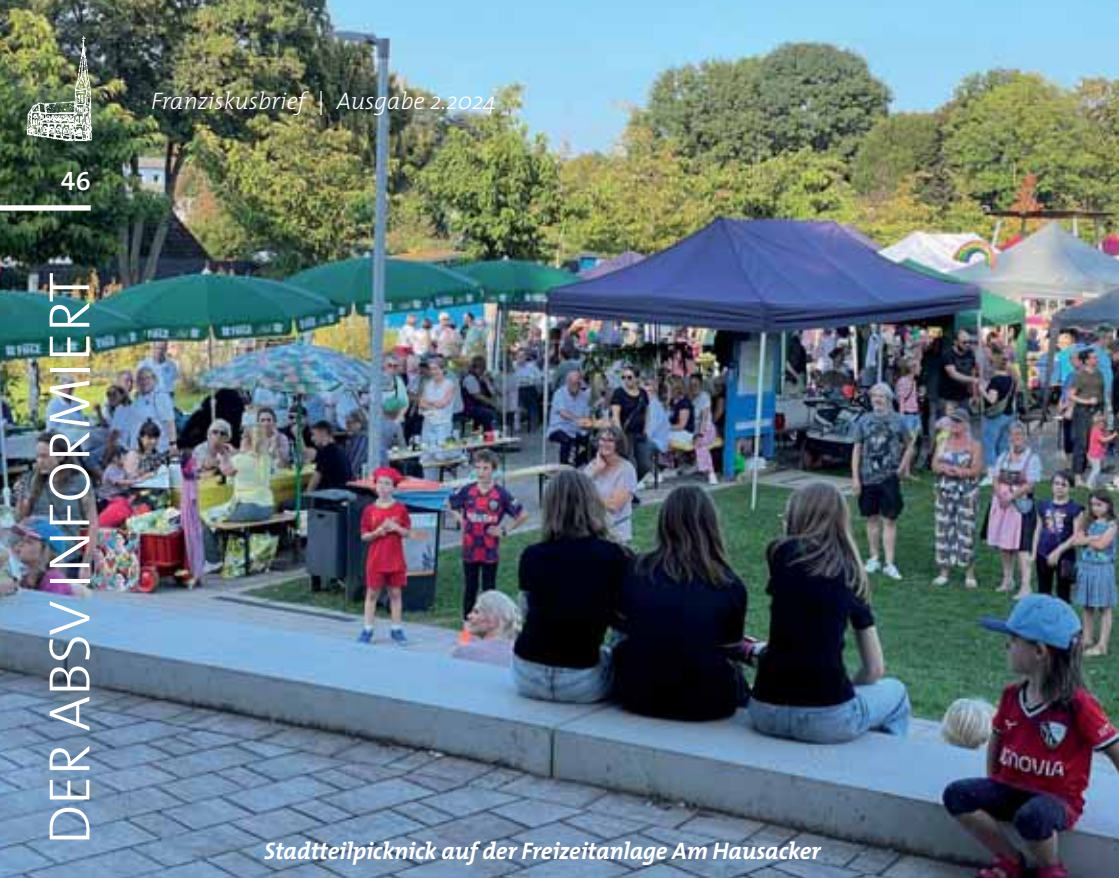
Stadtteilpicknick auf der Freizeitanlage Am Hausacker

gehören die DJK Adler Riemke, der Bürger-Schützenverein Hofstede-Riemke, die Handballer von SV Teutonia Riemke, die KJG Riemke, die örtlichen Parteien von CDU und SPD, die Kirchengemeinden sowie einige Gewerbetreibende aus dem Werbering Riemke wie z. B. der farma plus-Apotheke Glückauf oder der Malerbetrieb Heibroock.