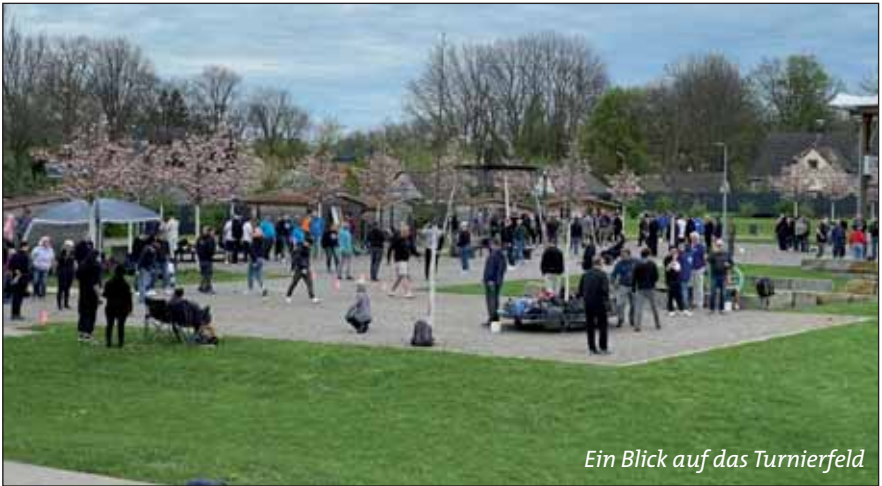
Ein Blick auf das Turnierfeld

Am 22. Juni 2024 spielten wir ein internes Fußballturnier in der Freiluft-halle aus. Auch eine Damenmannschaft sowie ein All-Star-Team waren mit dabei. Diese bunte Mischung sorgte für jede Menge Spaß und Unterhaltung bei den Zuschauern. Zum Spaß spielte das All-Star-Team im letzten Spiel im Nachthemd.